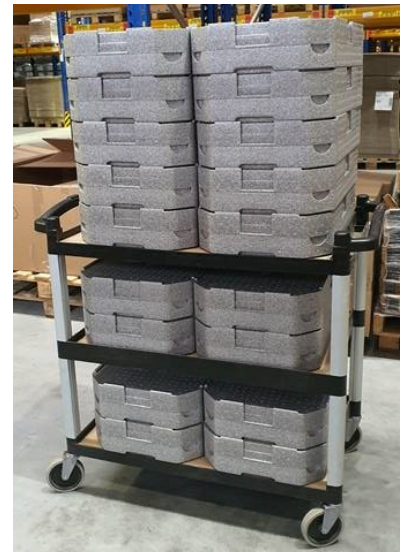
Hauteur du Plateau Tablotherm Cam GoBox: 12 cm