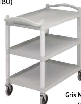
Gris Moucheté (480)